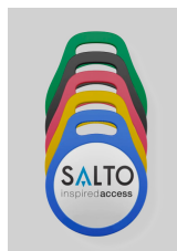
Llaveros Fob NXP MIFARE®