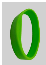
Pulseras de silicona NXP MIFARE®