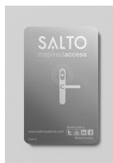
Tarjetas NXP MIFARE®